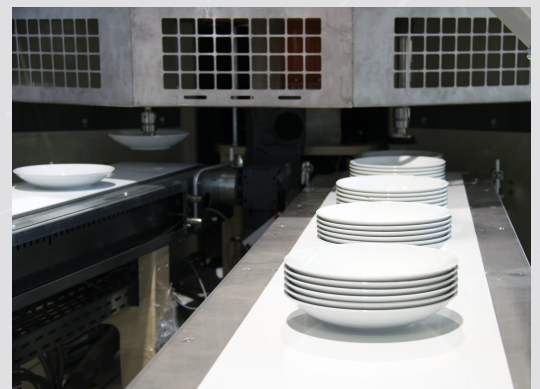
Zu- und Ablaufband