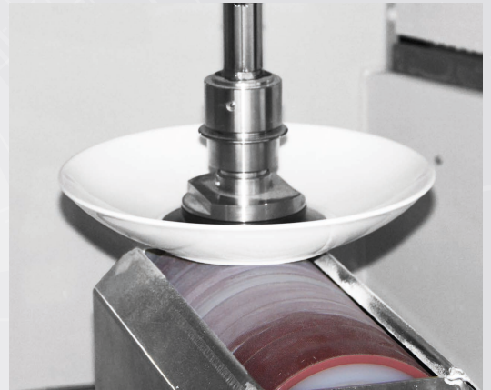
Fußschleifen runder Artikel